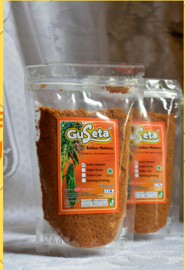
Gula Semut 250 g Rp 14.000 500 g Rp 23.000 1000 g Rp 45.000