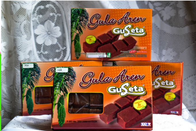
Gula Petak Rp 14.000