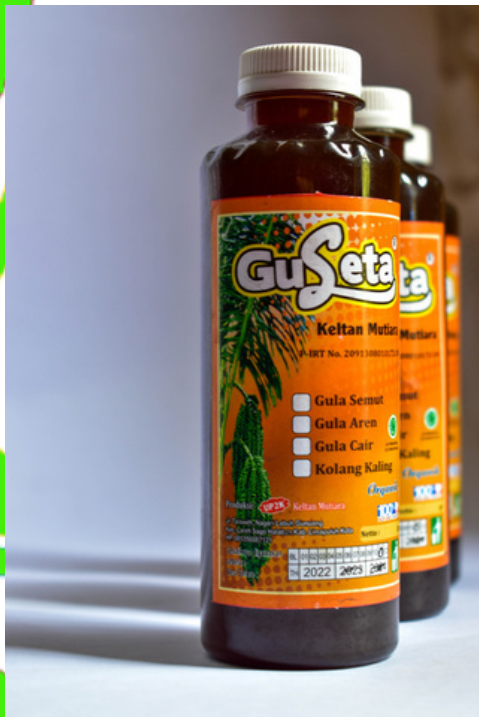
Gula Cair Rp 12.000